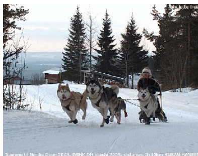
Træning til Nordic Open 2005

Det ultimative er ugerne i Funäsdalen i Sverige, hvor det rigtige slædehundeliv leves. De mange ture på slæden med hundene spændt foran er ”hvid lykke”. En slædetur er en naturoplevelse af de helt store: Hundene, der arbejder i front, lyden af poter i sneen, solens stråler i hundenes pels, mederne, der kører igennem sneen, og frosten i næseborene er det, som venter os i februar, og vi glæder os meget! Når man først har kørt på sne og fået den oplevelse i blodet, ja så må man bare have mere!