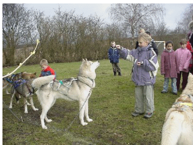
JarJar får en godbid af en skoleelev

Det er vigtigt for os, at både vores hunde og de besøgende får en positiv oplevelse. Vi gør også meget ud af at fortælle specielt børn, hvordan man går til en hund, og hvordan man får den bedste kontakt – dette med udgangspunkt i et meget udmærket materiale udarbejdet af DKK. Når vi bliver bedt om at komme ud på