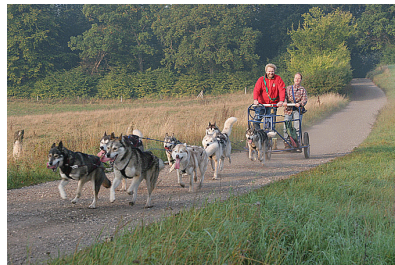
Træning i oktober

Begrebet ”Kaffeklubben” er én af de dejlige ting, der er fulgt med hundelivet – de mushere, der træner i Hvalsø, drikker morgenkaffe sammen efter træning, og i sommerperioden, når hundene ”ligger stille”, mødes vi hos hinanden til grillaftener eller kaffe/kage-eftermiddage for på den måde at holde kontakten og den sociale side ved lige. I Kaffeklubben støtter vi på den måde op om hinanden og hjælper med gode råd og praktisk hjælp. Det er guld værd, hvorfor det er så vigtigt at bevare den gode tone og stemning – til trods for